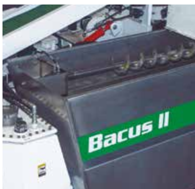
TOLVAS AMPLIAS E INDEPENDIENTES