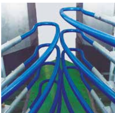
CABEZALES DE COSECHA REGULABLES Y DE FACIL ARMADO