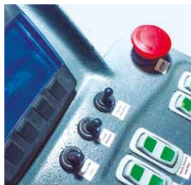
MANEJO DE OPERACIONES